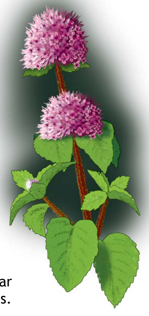
Menta de auga ( Mentha aquatica ) Ule moi ben e empregase en infusión para facilitar a dixestión e para aliviar as picaduras de estrugas.

Mais neste bosque non todo son árbores e baixo a súa cuberta numerosas plantas tinguen de cor o bosque: