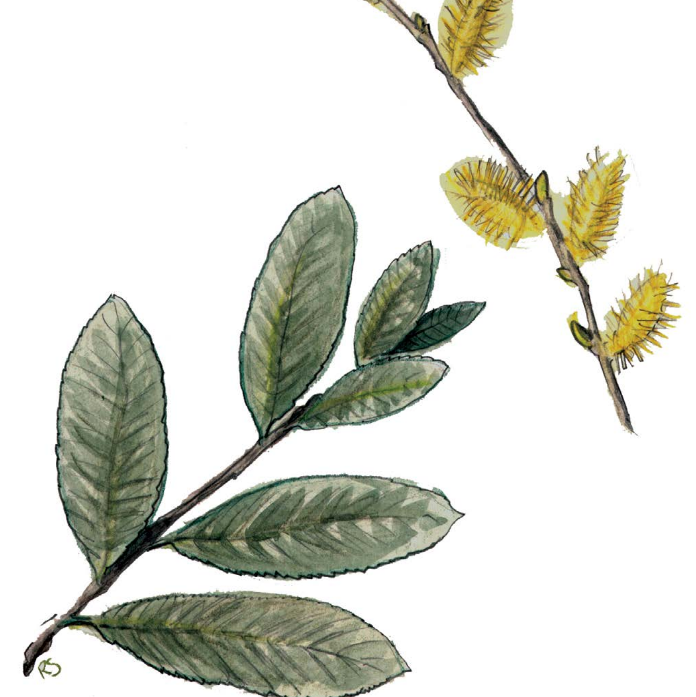
Salgueiro ( Salix atrocinerea ) Da súa casca extraíase a salicina para elaborar o ácido acetil-salicílico e ademais as súas longas e flexibles polas sirven para facer cestas tradicionais.

Mais neste bosque non todo son árbores e baixo a súa cuberta numerosas plantas tinguen de cor o bosque: