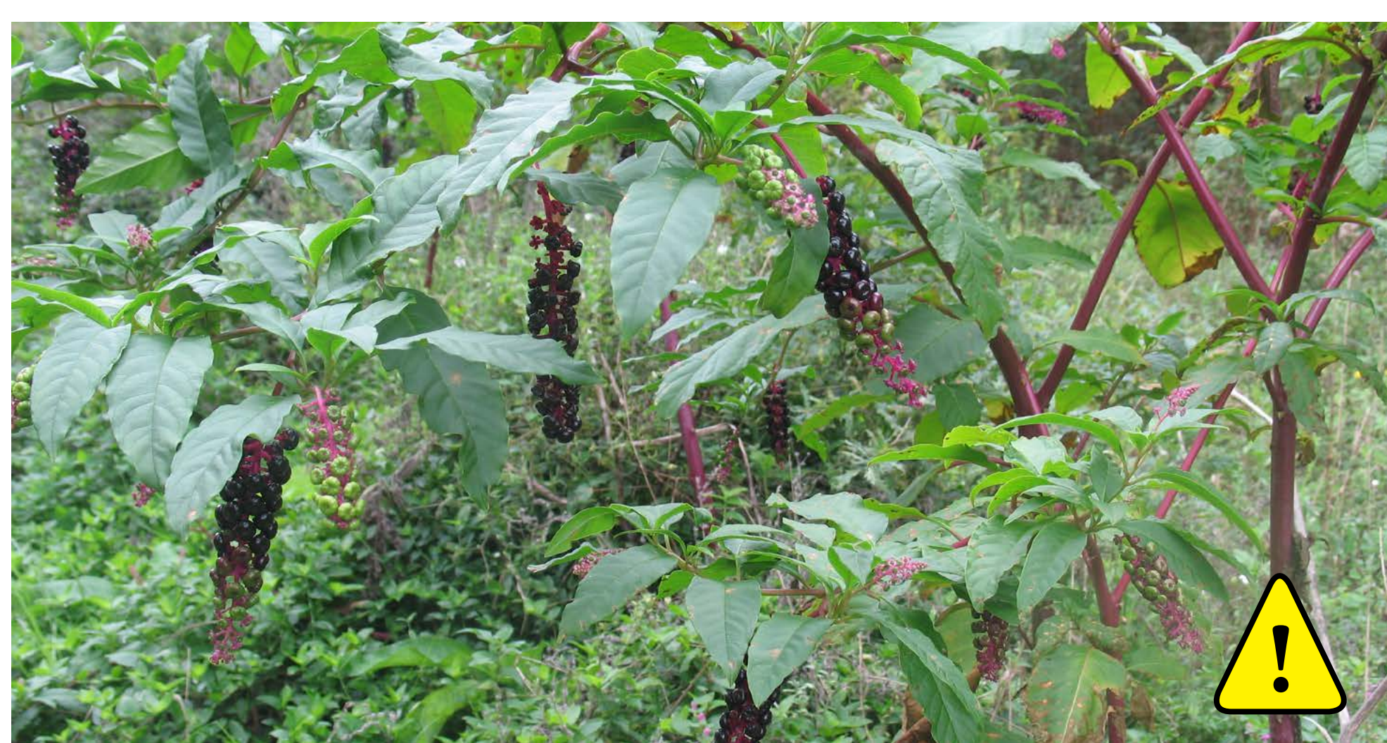
Uva das américas ( Phytolacca americana ) Procedente do centro e leste dos Estados Unidos é unha especie invasora en Inglaterra, Italia e outros lugares de Europa e pode causar graves perdas como mala herba nos cultivos

As especies exóticas e invasoras vexetais pódense converter nunha grande ameaza que desprace ás especies nativas ou autóctonas. Neste itinerario poderemos ver algunhas especies como o eucalipto, o falso bambú, a tritonía, as acacias e mimosas, uva das américas..