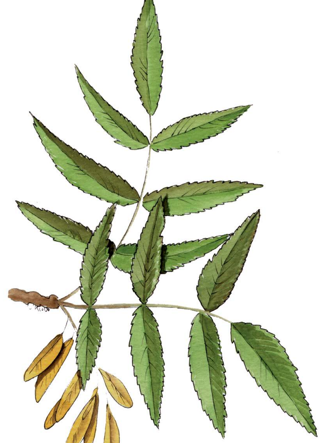
Freixo ( Fraxinus angustifolia ) A súa madeira, doada de traballar, usábase para facer os mangos das ferramentas e tamén para os eixos dos carros.