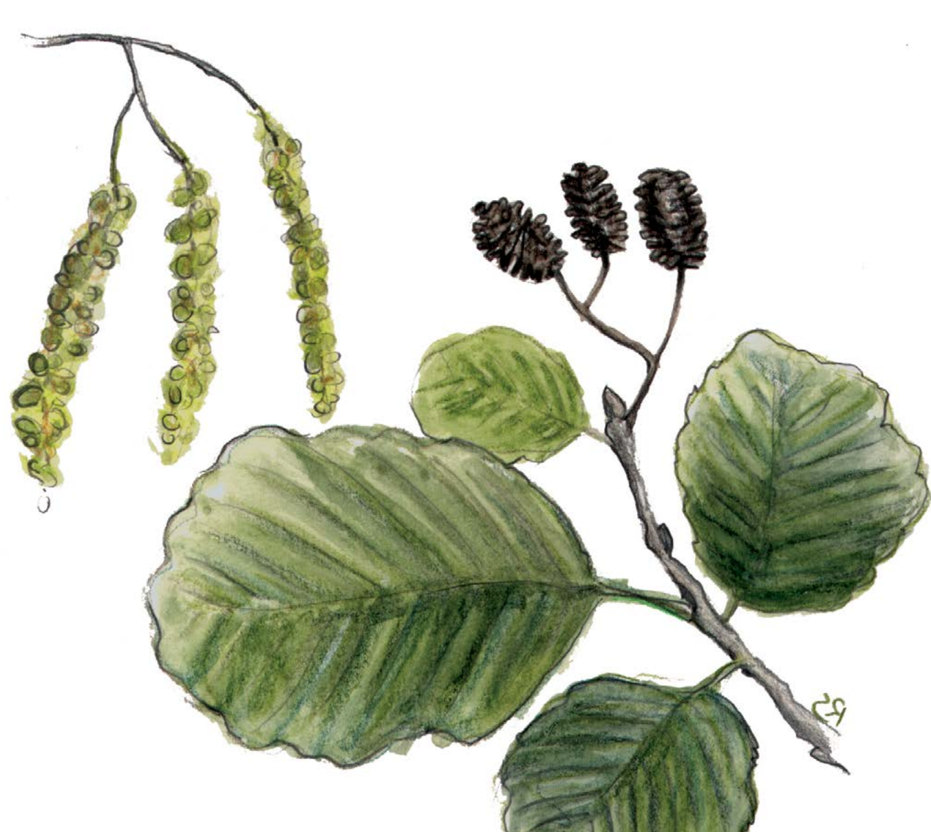
Ameneiro ( Alnus glutinosa ) Pode alcanzar ata 25 m de altura e as súas raíces, fixan o nitróxeno da atmosfera, arriquecendo enormemente o solo onde viven.